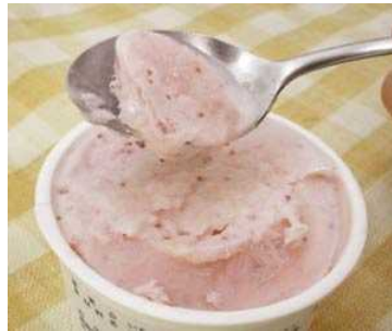
搾りたて牛乳と野菜と果物のアイス クリーム 価格: 3,654円(送料込)