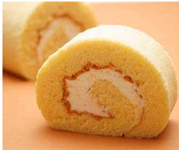
スヴニールマン 和三盆ロール 価格: 1,990円(送料込)

「Oisix(おいしっくす)」でのお歳暮は年々増加、昨年ははじめて受注件数が1000件を突破しました。本年度は商品ラインナップの充実により、約2.5倍の3000件の受注を予定しています。