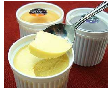
無添加・無着色 焼きいもなめらか プリン(紅、紫、橙) 価格: 3,990円(送料込)