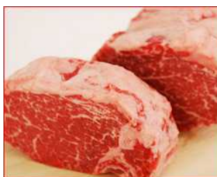
飛騨牛1頭から2本(5セット)しかとれないヒレ肉