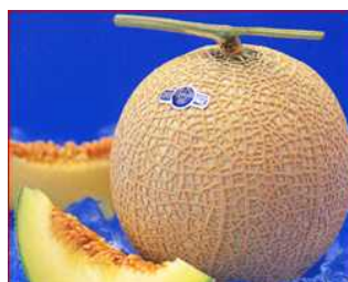
糖度15度以上のクラウンメロンは収穫量の3%以下