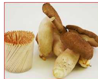
長さ10cmを超える巨大シメジ