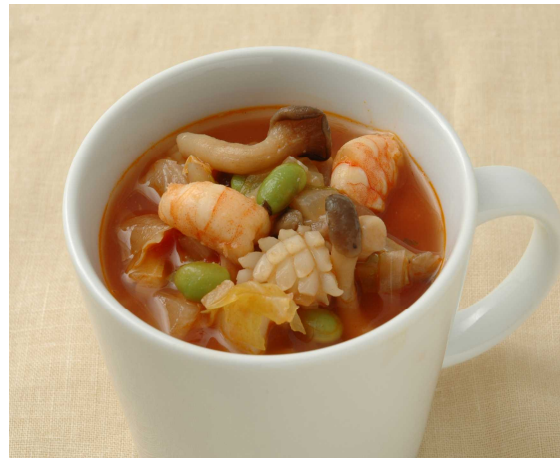
具たくさん野菜と魚介のミネストローネ

「Fitness Deli」シリーズは、「トータル・ワークアウト」と「Oisix(おいしくす)」が、カラダを美しく保ちたい人のためのフィットネス専用食として昨年10月に共同開発したシリーズです。1食あたり100kcal以下(1)ながら、高たんぱく質を含み、理想的なカラダ作りをサポートします。これまで6種類のスープを発売。以来、2万食以上を売り上げました。