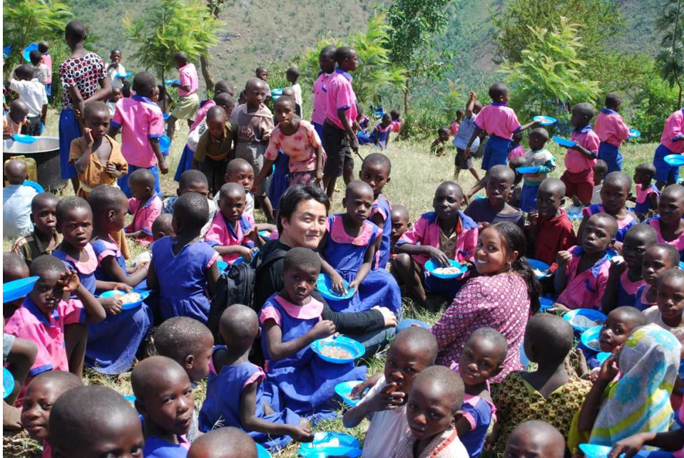
TABLE FOR TWO について

毎年スイスで開かれる「世界経済フォーラム(通称:ダボス会議)」に出席する日本人有志メンバーが中心となり構想し、日本発で開始した社会貢献活動です。竹中平蔵氏や川口順子参議院議員などが相談役として若手の社会活動を支援しています。カロリーを抑えた食事で肥満を解消、参加者自身が健康になると同時に、食事代の一部に含まれる寄付により開発途上国の支援ができる運動です。