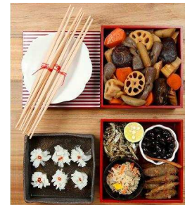
食材セットで作れるメニュー6レシピ

家庭料理を中心としたアイデアあふれるレシピは、年代を問わず幅広い層から支持されている。ベストセラー『ごちそうさまが、ききたくて。』(文化出版局・刊)をはじめ、これまで送り出した料理本は100冊以上、発行部数は2,200万部を超える。暮らしにまつわるショップや飲食店などをプロデュースし、オリジナル雑貨なども展開。世界に向けて英語で日本の家庭料理を紹介する活動などを行なっている。