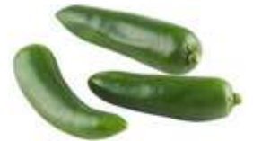
こどもピーマン ピー太郎

「こどもピーマン ピー太郎」今まで子供が嫌いなピーマンを刻んだりして調理工夫をして食べてもらう家庭が多かった中、苦味が少ないので生のままでも食べることができる、料理の時間も短縮でき、子供のピーマン嫌いも克服できるピーマンです。